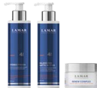
арт. 0241 арт. 0242 арт. 0243

Применение: небольшое количество крема равномерно распределить по поверхности лица