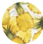
экстракт плодов ананаса