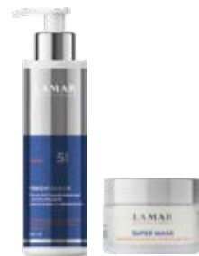
арт. 0244 арт. 0245

Применение: нанести небольшое количество маски на влажную кожу лица, распределить круговыми движениями, избегая области вокруг глаз. Оставить на 5–7 минут, затем тщательно смыть. (арт. 0245)