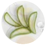
экстракт алоэ вера