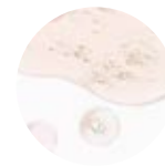
АНА - кислоты