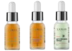
арт. 0217 арт. 0218 арт. 0225

Применение: нанести небольшое количество сыворотки на предварительно очищенную кожу лица и шеи. Распределить по коже, затем нанести крем или маску. Рекомендуется использовать ежедневно.